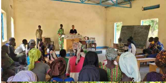
( 마을교회 설교 )